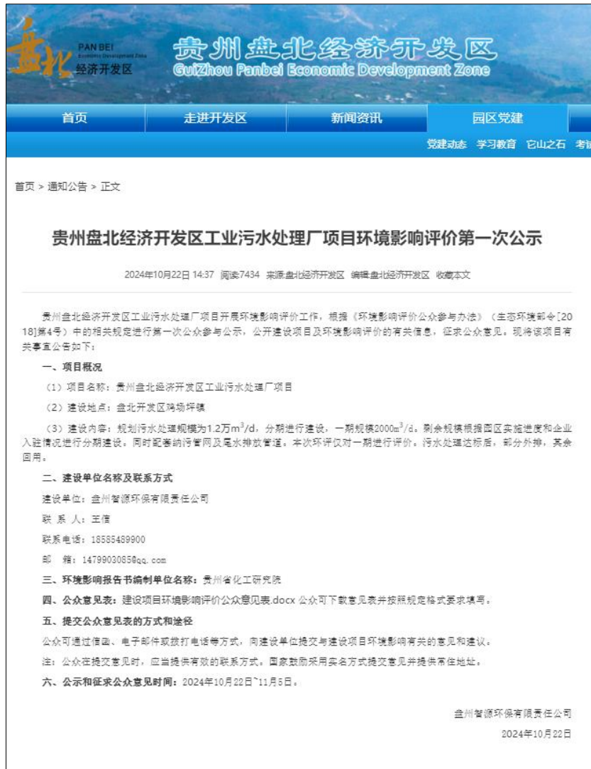
图 2-1 第一次公示（网络公示截图）