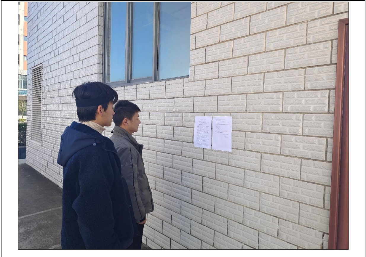
图 3-4 第二次公示（张贴）