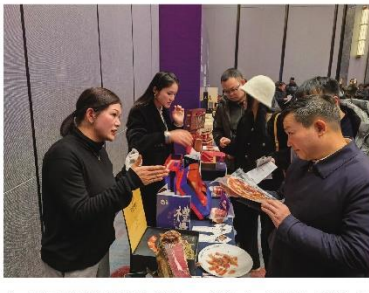
参赛选手在大赛现场展示他们的创意作品,并接受评委和观众的点评。现场气氛热烈,大家对作品的创意和实用性都给予了高度评价。

六盘水首届伴手礼创意设计征集大赛,在六盘水市委、市政府的高度重视和大力支持下,顺利完成了各项赛事工作。大赛期间,组委会组织了多场线上线下交流活动,促进了参赛选手之间的交流和学习。 此次大赛的举办,不仅是一次设计水平的较量,更是一次对六盘水地域文化的一次深度挖掘和展示。通过大赛,广大设计爱好者对六盘水独特的自然风光、人文历史和民俗风情有了更深入的了解,也为六盘水伴手礼的创意设计提供了丰富的灵感来源。 组委会表示,未来将继续秉承“遇见臻好,凉都有礼”的理念,不断提升大赛的知名度和影响力,为六盘水伴手礼产业的繁荣发展做出更大的贡献。