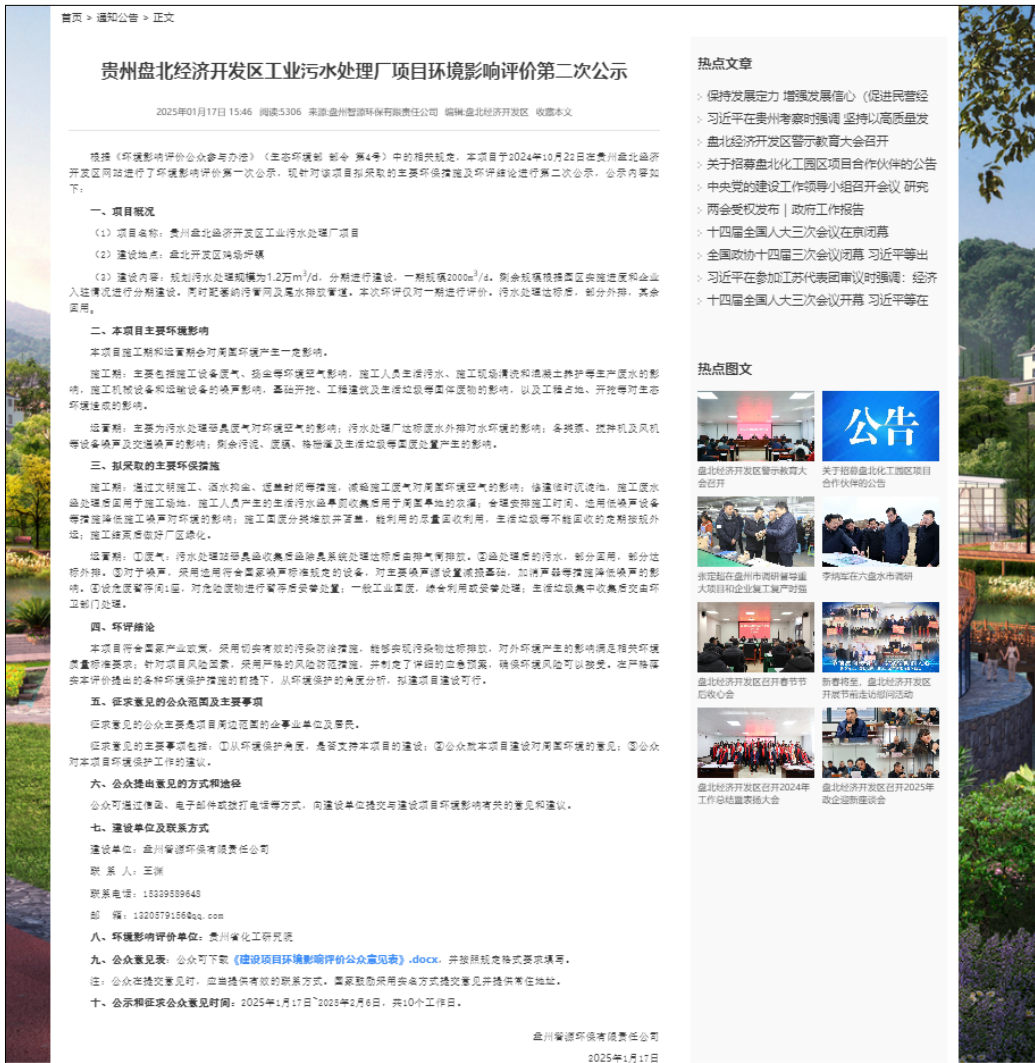
图 3.1 第二次公示（网络公示截图）